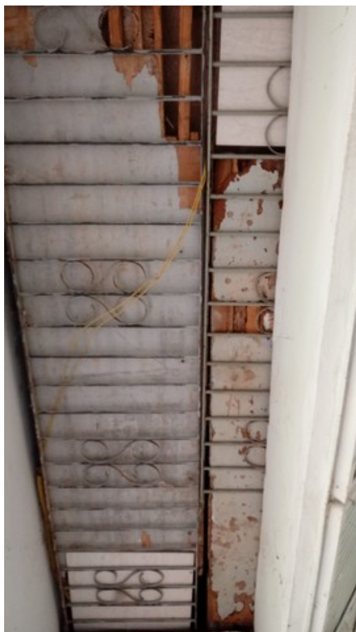
Forração do teto da entrada da Unidade