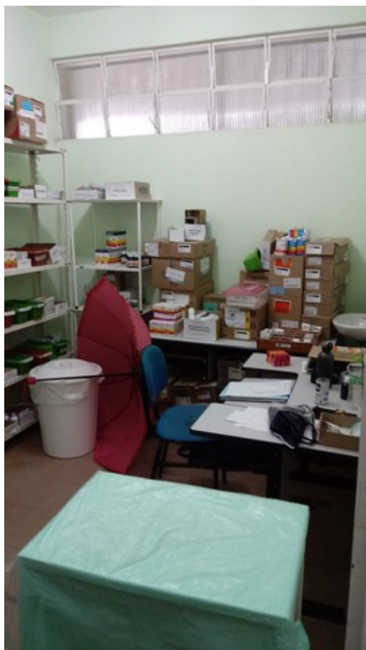
Farmácia e depósito de medicamentos