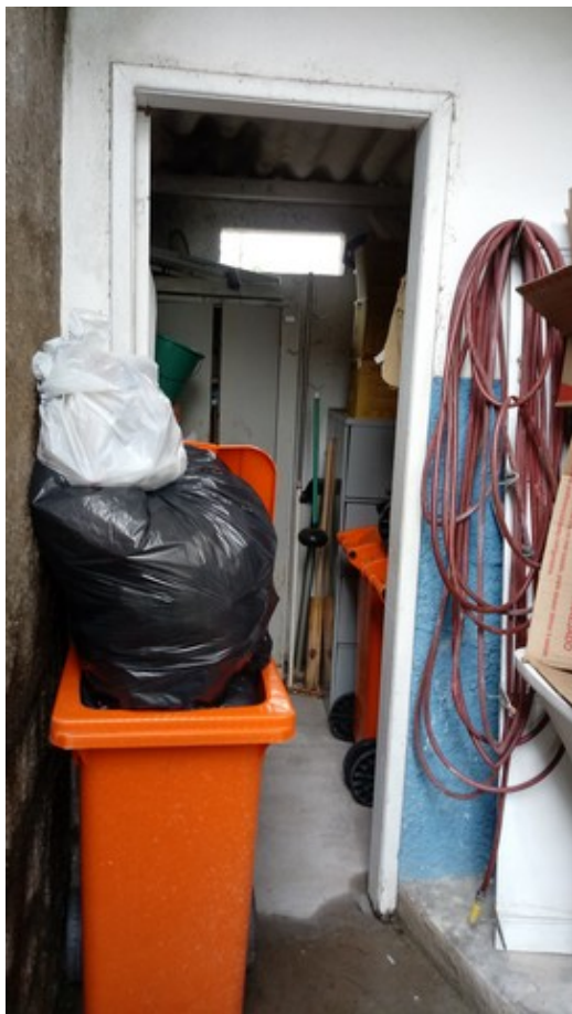
DML e depósito de resíduos sólidos.