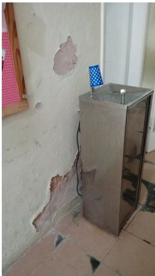
Corredor de acesso aos consultórios de clínica médica