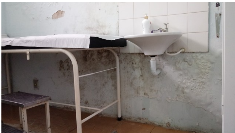
consultório clínico 2