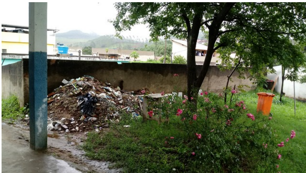
Entulho amontado na frente da unidade.