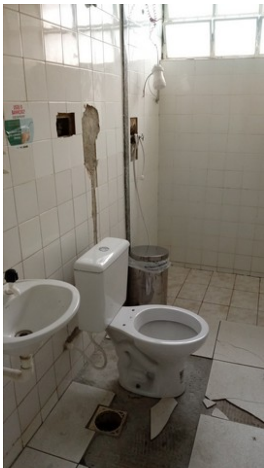
Banheiro dos funcionários. Único em funcionamento na Unidade.