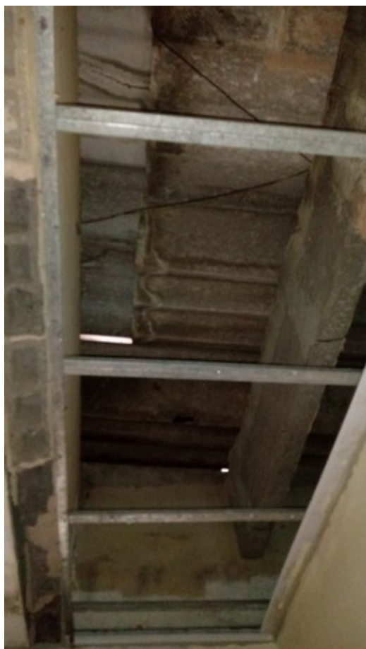
Teto do corredor de acesso à nova ala.