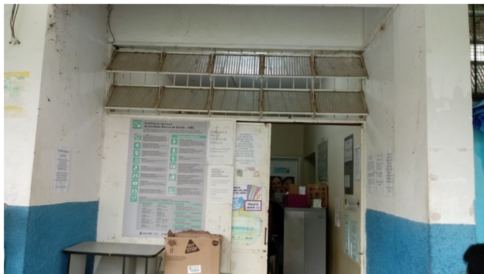
Entrada da Unidade