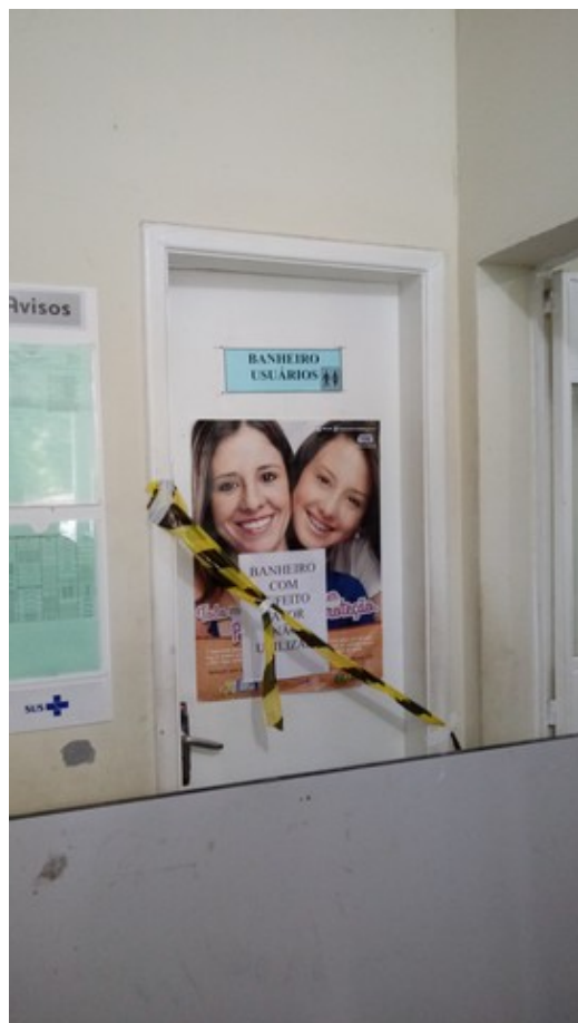
Banheiro Unissex para usuários da Unidade. Fora de funcionamento.