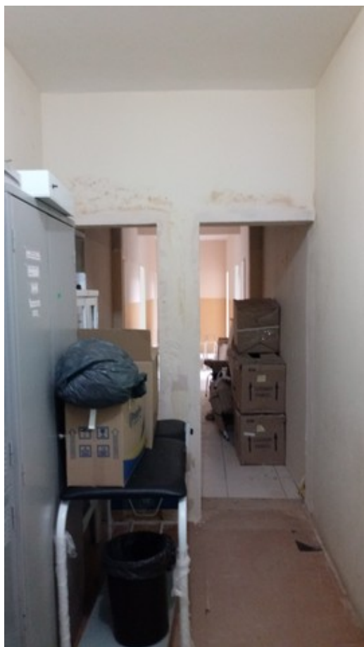
Corredor de acesso à nova ala. Construção em andamento no presente momento.