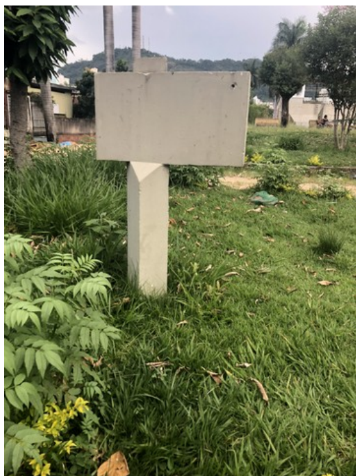
Local destinado à placa de identificação da Praça