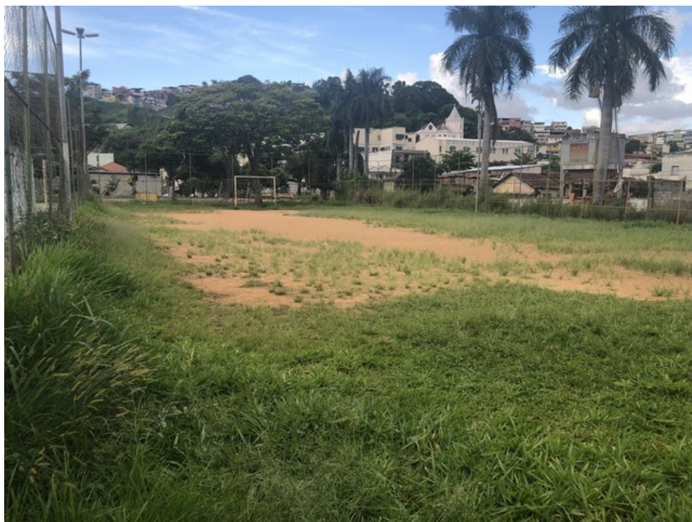
Campo de futebol society