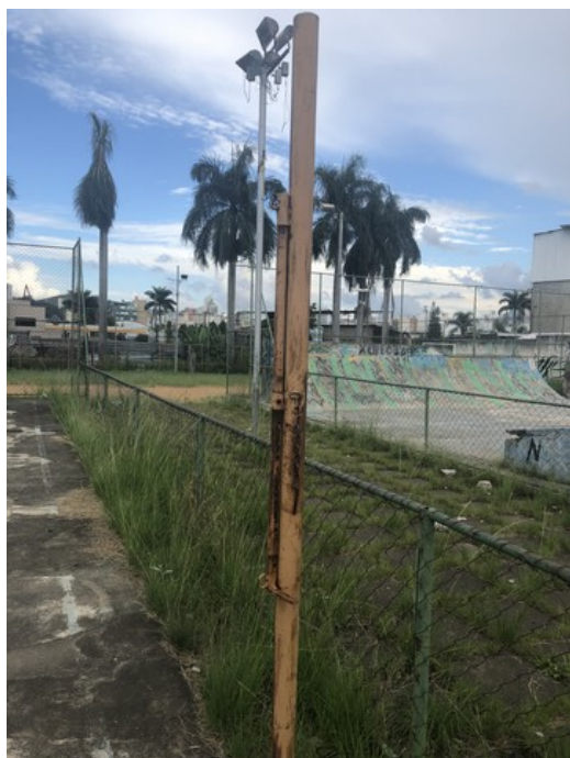
suporte para rede de voleibol