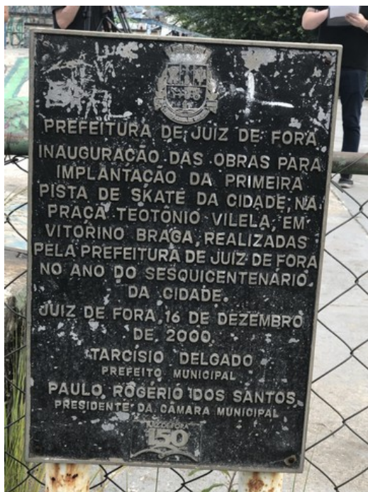
Placa de inauguração da Pista de Skate