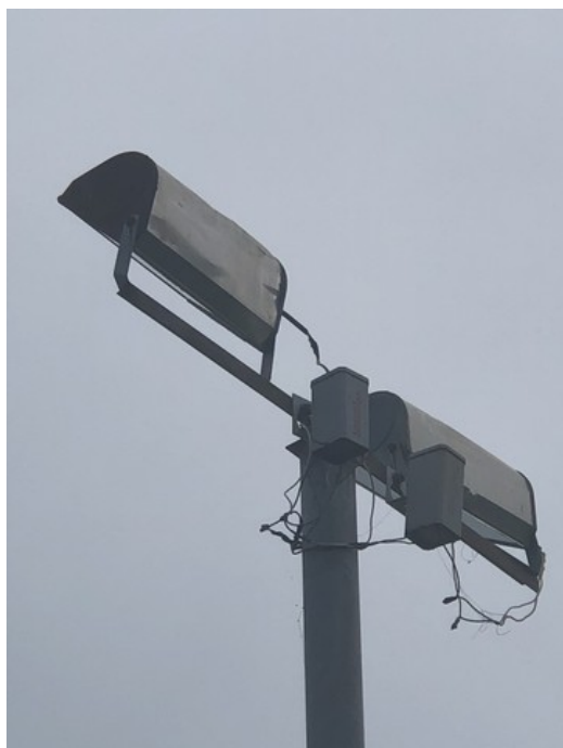
Iluminação danificada da Praça