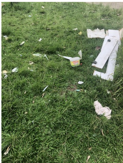
Acúmulo de lixo