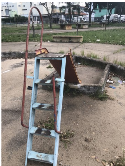
Brinquedo danificado do Parquinho