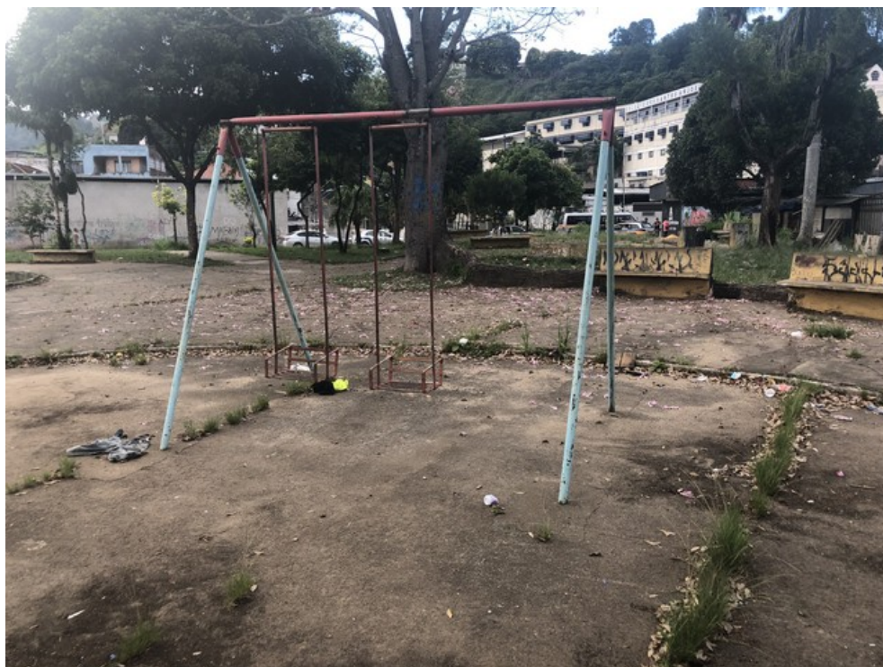
Brinquedo danificado do Parquinho