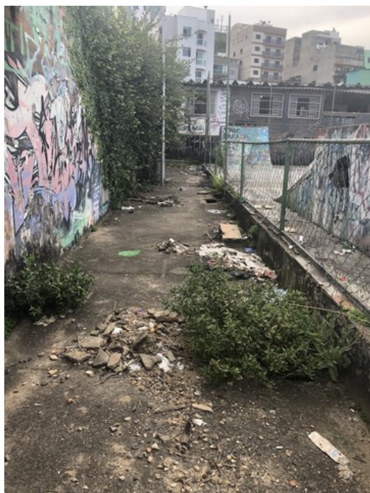
Corredor localizado atrás da Pista de Skate