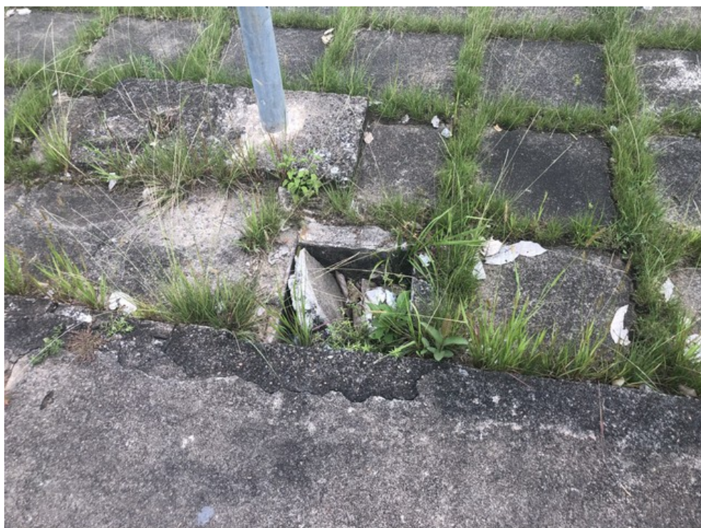
Buraco no piso da Praça