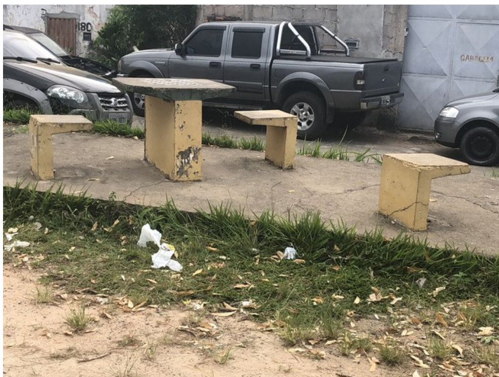
Mesas para dama