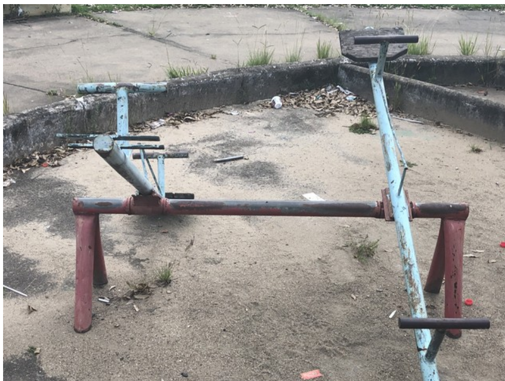
Brinquedo danificado do Parquinho