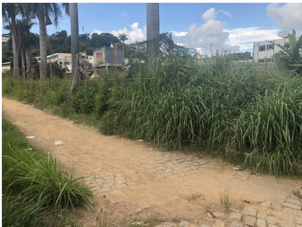
Travessa lateral da Praça