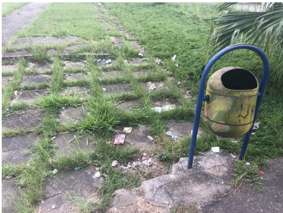
Lixeira pichada e danificada