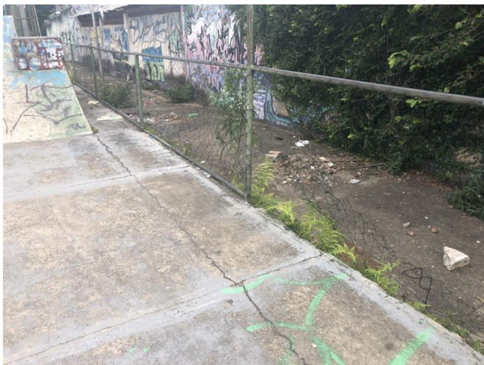
rachaduras na pista e alambrado danificado na Pista de Skate