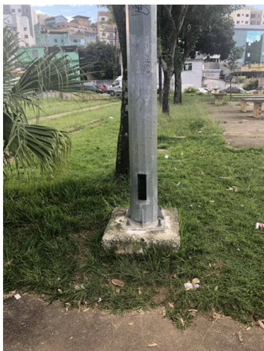
Buraco no poste