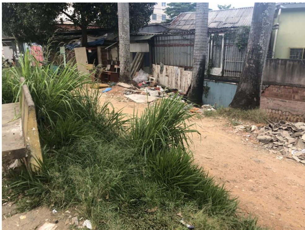
Mato alto e acúmulo de entulho