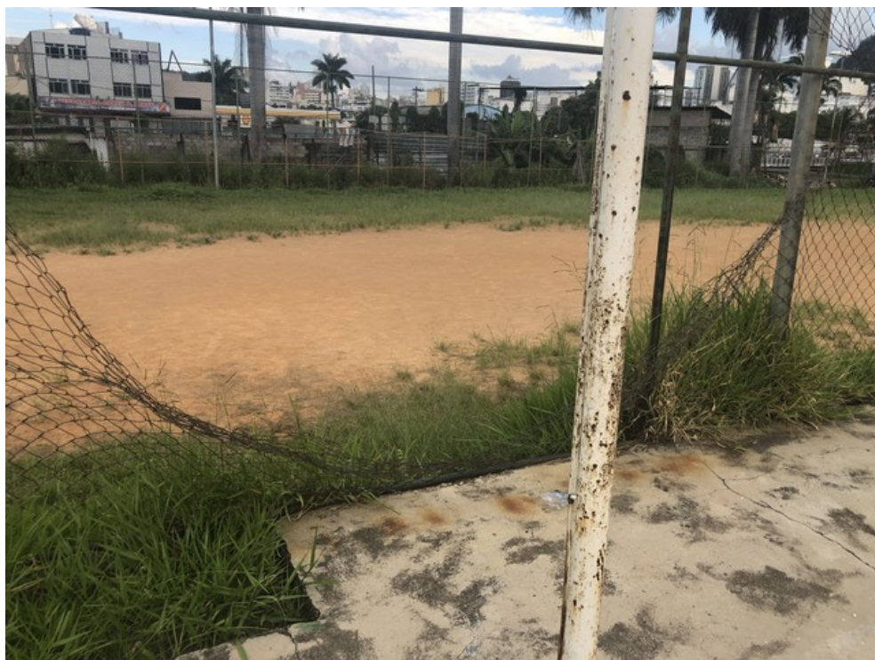
Alambrado localizado entre a quadra e o campo society danificado