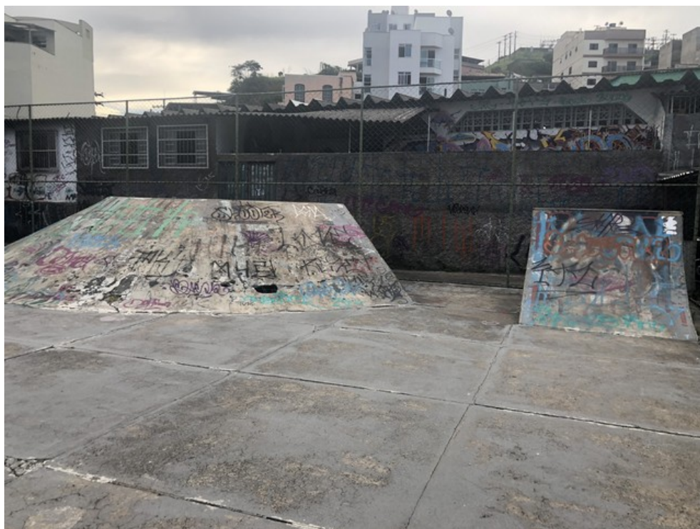
Pista de Skate