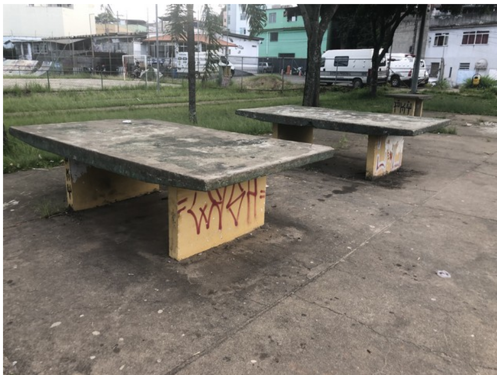
Mesas de ping pong