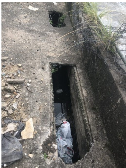
Buracos com lixo e acúmulo de água no corredor localizado atrás da Pista de Skate