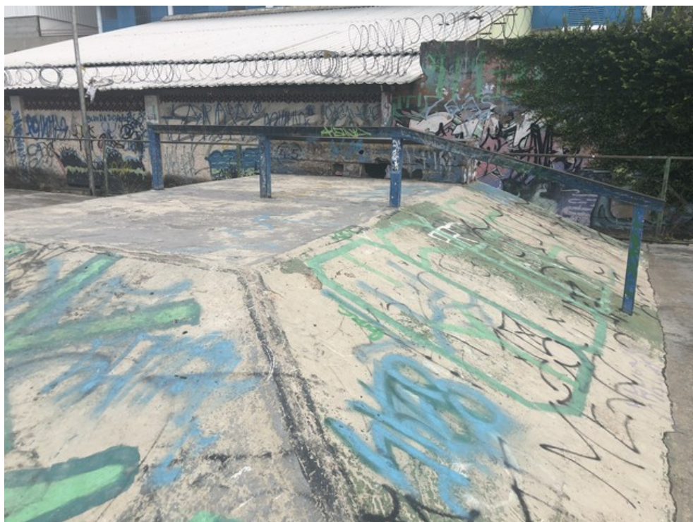
Pista de Skate