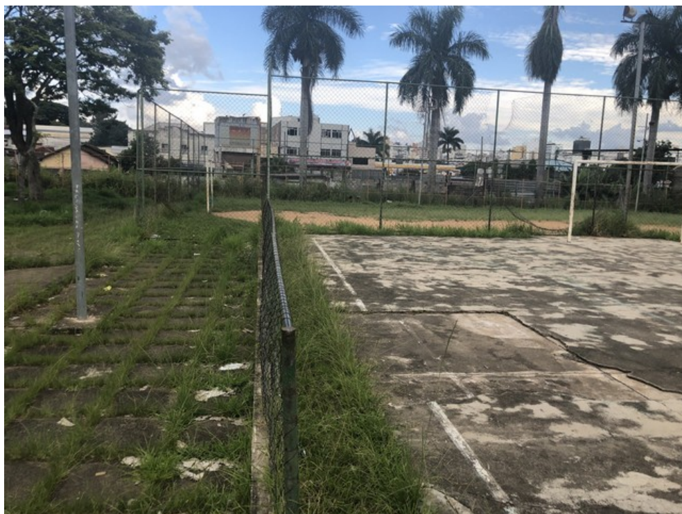
Quadra de futsal/voleibol