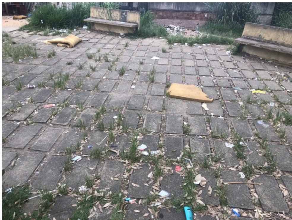
Invasão de vegetação, acúmulo de lixo e entulho